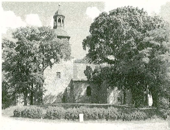
Vehlefanzener Kirche aus dem 13./15. Jahrhundert

Vehlefanz war im 18. Jahrhundert das größte Dorf im Glien. Theodor Fontane stellte am Abend des 18. April 1864, anlässlich der Siegesbotschaft von der Schlacht bei Düppeln gegen die Dänen in Vehlefanz fest: "Tanz ist heut im Krüge zu Vehlefanz" und ihm hat es scheinbar in Vehlefanz gefallen.