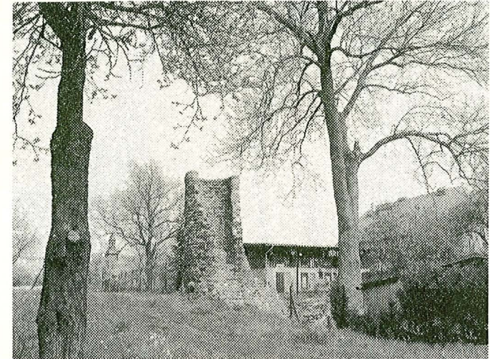
Reste einer Wasserburg aus dem 13. Jahrhundert

Ein Ortsteil in der Gemeinde Oberkrämer im Glien am Rande des Krämer-Waldes mit erstaunlicher Geschichte